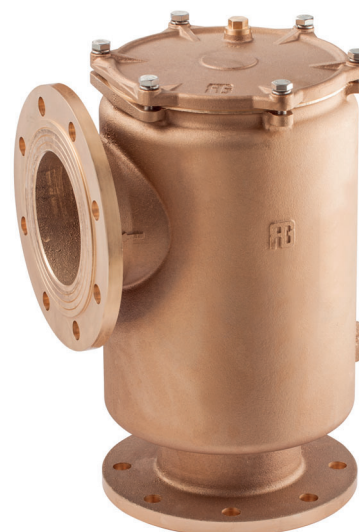
Tabella flange a pag. 195 Flange table on page 195

Filtro omologato RINA MAC RINA MAC certificate